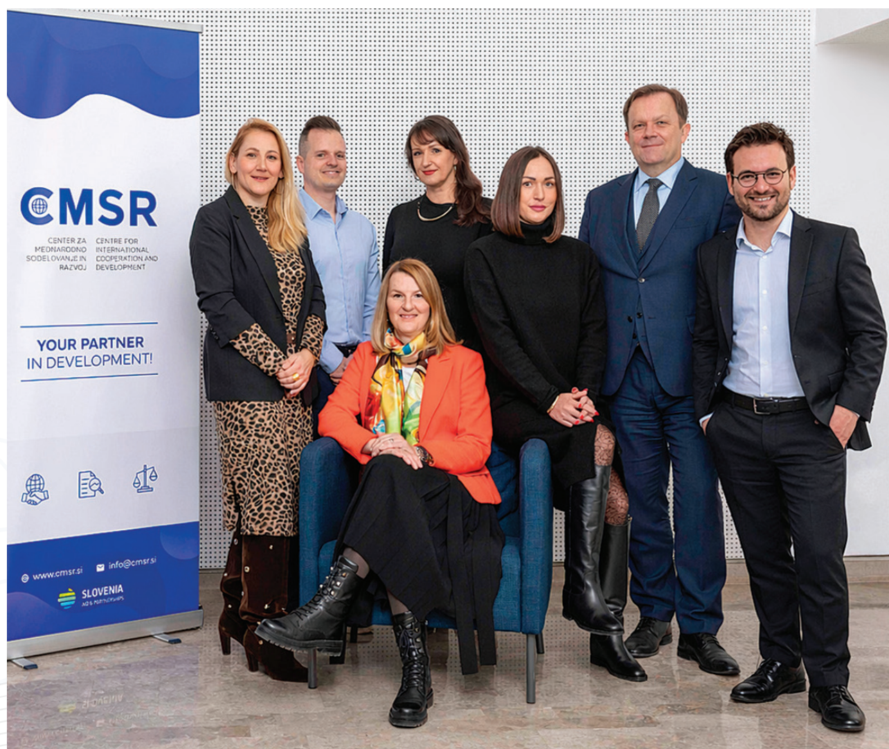
Ekipa CMSR, 2025

Delo v CMSR je organizirano v okviru naslednjih organizacijskih enot: Sekretariat, Oddelek MRS, Oddelek ekonomskih raziskav ter Oddelek pravnih analiz in publicistike.